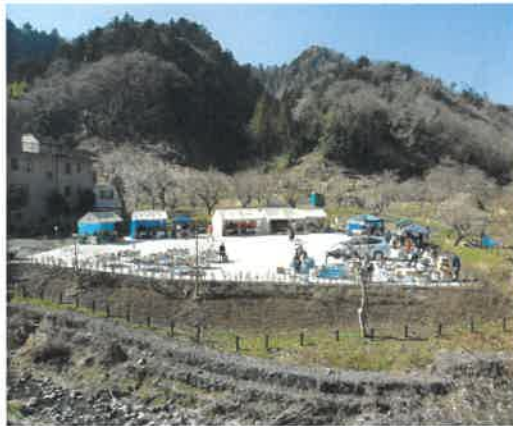
新たな「梅祭り」の風景！

当施設に隣接した、施設では「裏山」と呼んでいた場所に、「摺指まちの広場」という広場が完成。今年からその広場で開催することになりました。来年も3月第2土日に開催予定です。