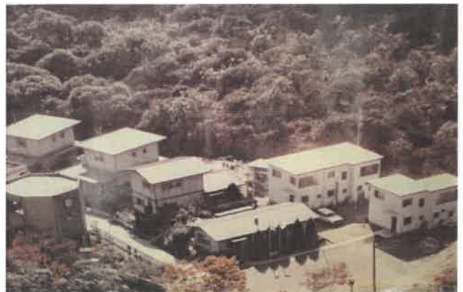
【平成元年当時の本園】

子どもたちには、身近にある高尾の自然あふれる環境を「自然体験プログラム」として活用しながら、数多くの豊かな経験をして欲しいとも考えています。